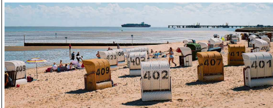
Het strand van Hooksiel (Duitsland).