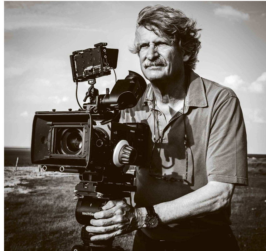
Filmmaker Pieter-Rim de Kroon over de Wadden: „We zetten de camera neer en hebben het over ons heen laten komen.”

„We wilden geen interviews en ook geen tendentieuze voice-over die aan jou als kijker vertelt wat je ervan moet vinden. Wat je ervan vindt moet je zelf bedenken. In het beeld zit zoveel, dat vertelt eigenlijk alles al. Bij het begin van de opnamen hadden we ook bedacht dat we niet gingen inzoomen op de camera laten rijden. Dat leidt de kijker af, in het beeld zijn al allemaal subtiele processjes aan de gang. Dus zeiden we: ‘Blijf met je poten van de camera af.’”